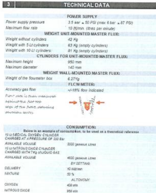
Εικόνα 3 Τεχνικά χαρακτηριστικά συσκευής Master Flux.

ενώ για ενήλικες αυτή μπορεί να φθάσει μέχρι και τα 10 lit/min. Η μέση ροή για την κοστολογική προσέγγιση υπολογίζεται στα 6 lit/min ανά ασθενή.