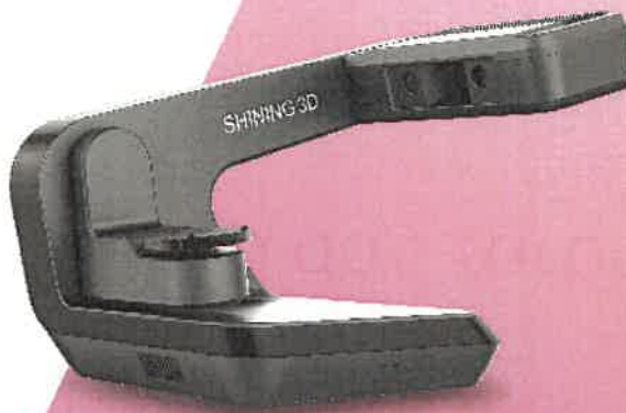
AutoScan DS-EX Pro (H) 5.0 Megapixel for Implant