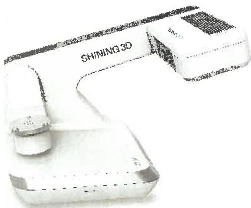
AutoScan DS-EX Pro (C) Outstanding Scan Speed